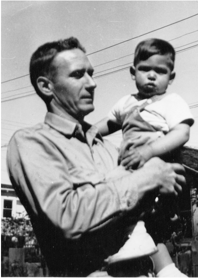
Paul Jobs met Steve, 1956