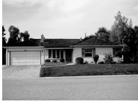
Het huis in Sunnyvale met de garage waarin Apple werd geboren