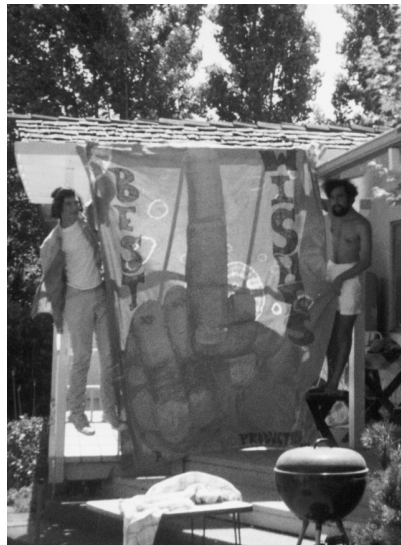
Met het spandoek 'SWAB JOB'