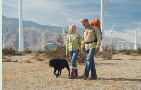
Ce sont mes parents avec leur chien Youki.