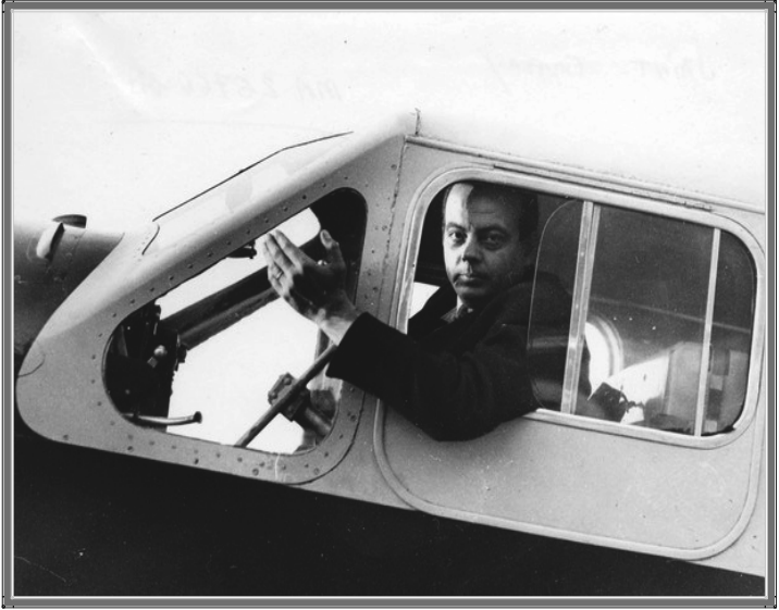
Saint-Exupéry en Toulouse, France, 1933