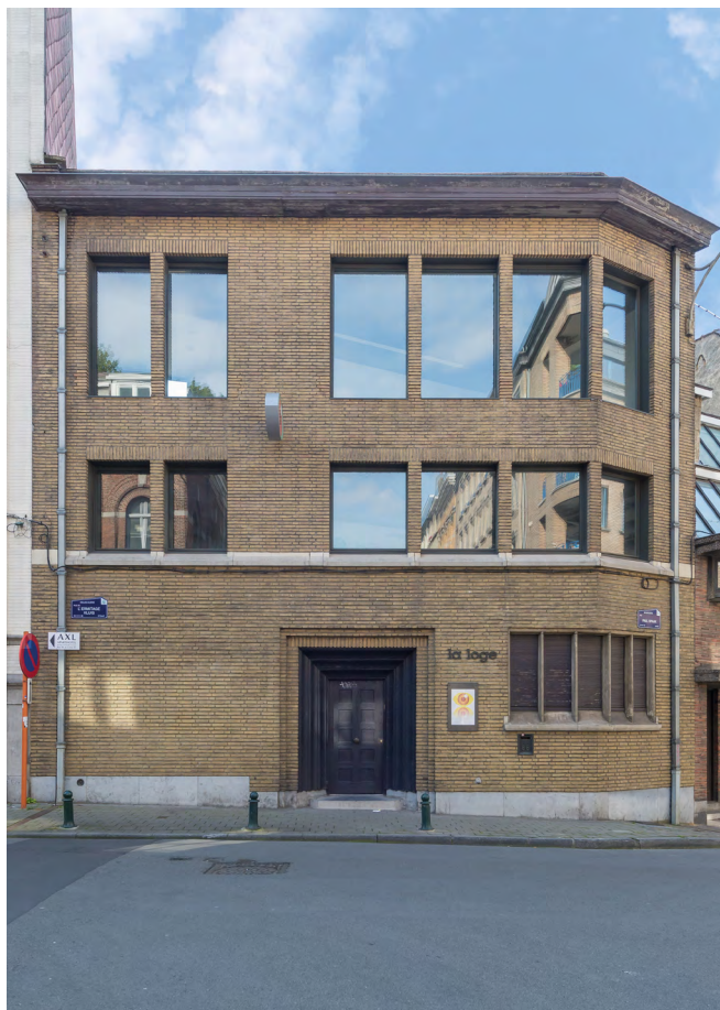
◀ Ancienne loge maçonnique

Moderniste de la première heure, Fernand Bodson (1877–1966) refusait les références aux styles anciens sans accepter pour autant de construire des bâtiments dépouillés à l'extrême. Animateur de revues, philanthrope engagé, il fut associé à la réflexion sur la reconstruction de la Belgique après la Grande Guerre, construisit des logements sociaux et mit au point des procédés de préfabrication. À la fin des années 20, excédé par le radicalisme du mouvement moderne, il prit ses distances et finit par s'installer aux États-Unis. Cette retraite volontaire explique pourquoi cet architecte reste peu connu du public.