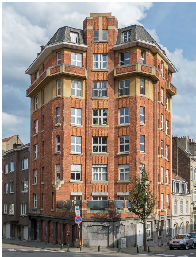
◀ Immeuble à appartements, rue de l'Ermitage 16, arch. J. Mouton