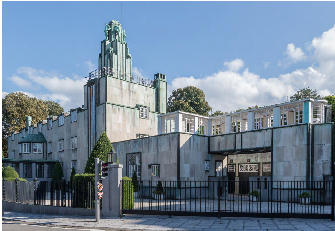
▲ Le Palais Stoclet, av. de Tervueren 279-281, Woluwe-Saint-Pierre, arch. J. Hoffmann, 1905-1911

produits par l'usage de la brique disposée en relief et de façon géométrique.