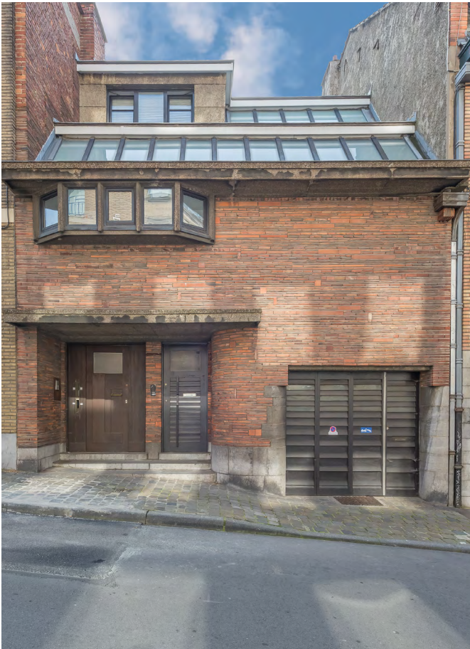
◀ Habitations, rue Paul Spaak 2-4, arch. F. Bodson

Côté impair, rue de l'Ermitage, se trouve le CIVA, Centre international pour la Ville, l'Architecture et le Paysage. Côté pair, après une enfilade d'immeubles plus modernes car construits après la guerre, là où tomba un V1 en 1944 (58 à 70), se succèdent une série d'immeubles de l'entre-deux-guerres : au 52, une habitation Art Déco (arch. Adolphe Puissant, 1923) aux agencements de brique originaux et présentant des chouettes stylisées sous les fenêtres du premier étage ; au 50, un immeuble à appartements Art Déco à l'entrée caractéristique (arch. Jos Mouton, 1925) ; au 48, un immeuble d'inspiration moderniste, construit pour l'entreprise de construction immobilière Les Pavillons français (arch. Marcel Peeters, 1938) ; au 46, un immeuble à appartements d'inspiration paquebot, à l'impressionnante volumétrie (arch. Lucien De Vestel, 1936).