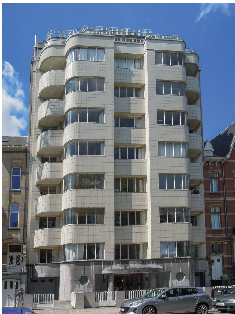
◀ La Cascade

salle de bain d'Ixelles . Il présente un mouvement de vague tant dans le jeu des volumes de la façade que dans la grille du jardinet, dans les vitrages d'angle et dans les plafonds des terrasses. Le porche, également arrondi, est encadré par deux fenêtres en forme de hublot.