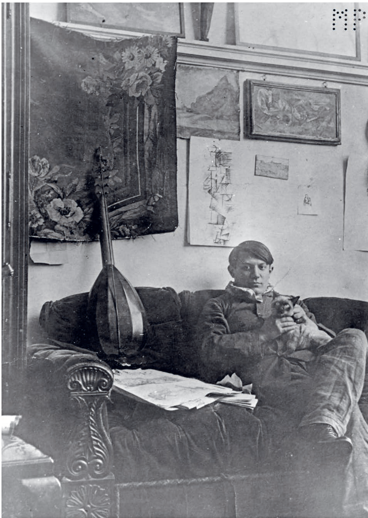
79. Anonyme, contretypage d'un tirage anonyme représentant Pablo Picasso assis sur un canapé dans l'atelier du 11 boulevard de Clichy, Paris, décembre 1910. Épreuve gélatino-argentique, 23,2 × 17,1 cm. Musée national Picasso-Paris, inv. MPPH15330