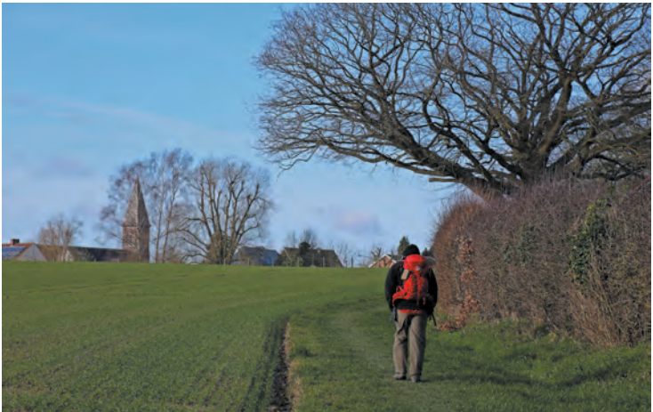
Un chemin herbeux entre champs et prairies