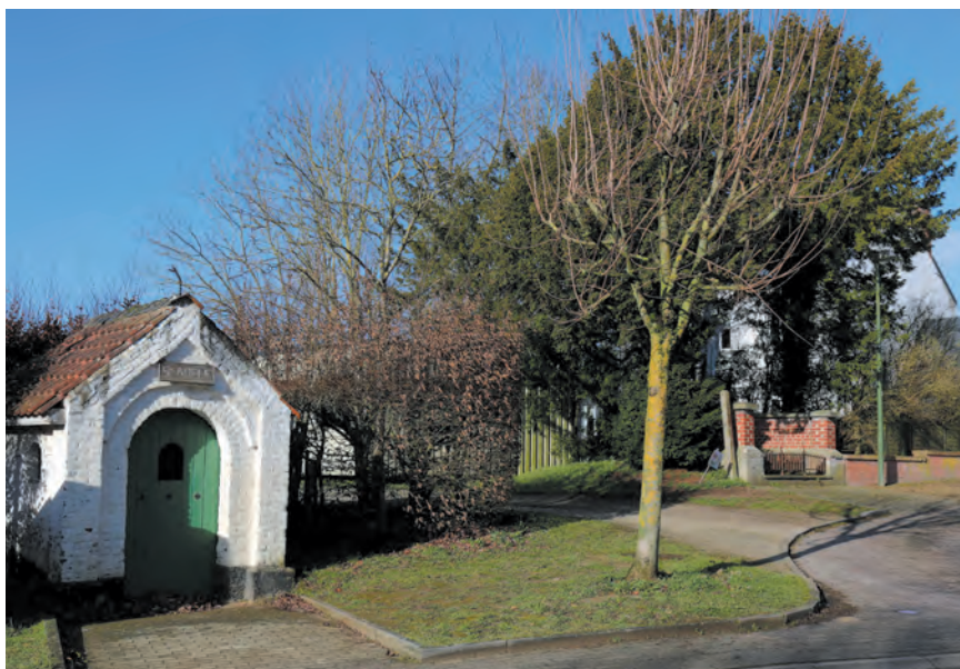
La chapelle Sainte-Adèle