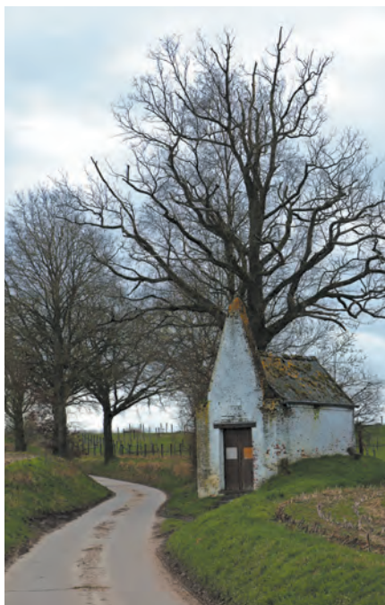
La chapelle Saint-Antoine