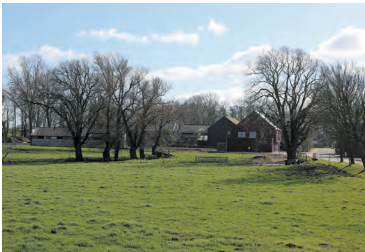
Le vallon de l'Ardennelle