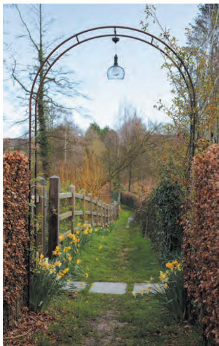
Le sentier balisé «Promenade de la fontaine Saint-Géry»