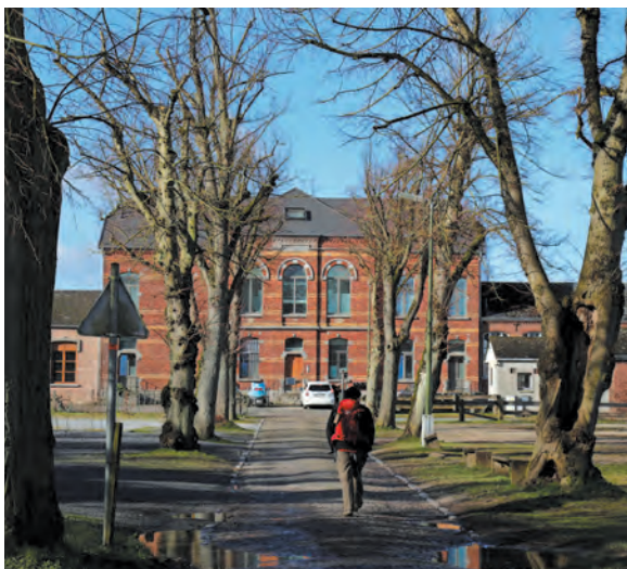
Vers le Musée français

Son eau fut utilisée par les habitants du village, il y a bien longtemps. Elle fut l'objet de diverses croyances dont celles de guérir les affections des yeux et de la bouche. En 1990, année des fontaines, elle fut restaurée, l'environnement aménagé avec l'installation d'un banc et d'une poubelle. L'endroit reçut un nouveau «rajeunissement» en 2017.