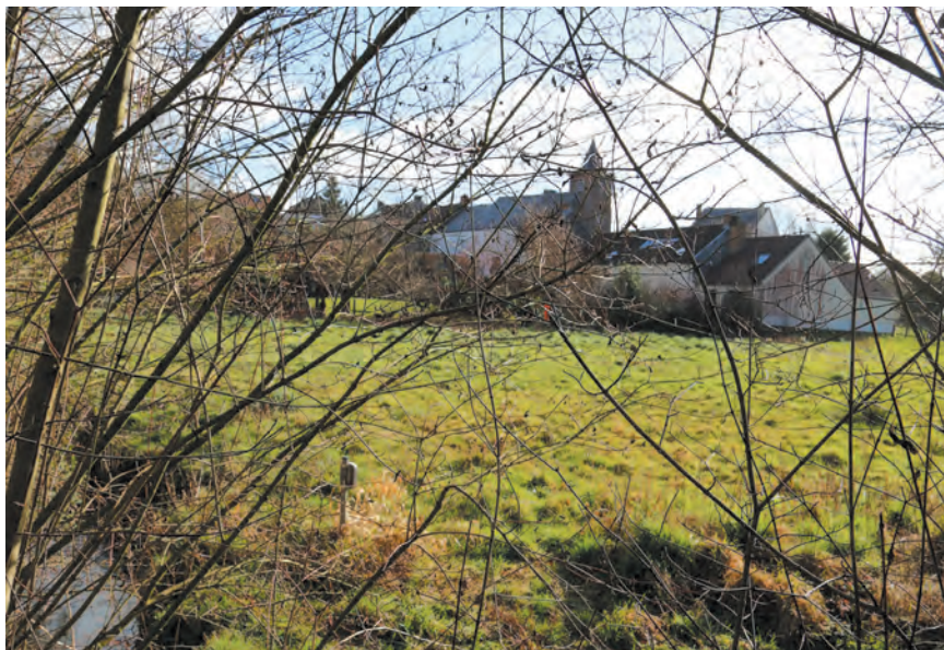
L'entité de Cortil-Noirmont et l'Orne