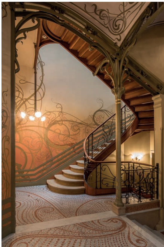
▲ Trappenhall in huis Tassel

openingen op de bovenste verdieping doen zelfs denken aan schietgaten. Het erkerraam, dat uit de gevel naar voren springt, heeft een heel organische vorm.