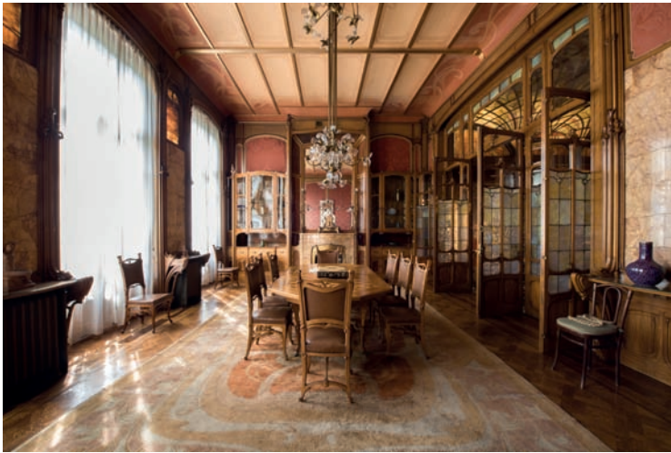
▲ Eetkamer in huis Solvay

Toegevoegd aan de Werelderfgoedlijst van Unesco in 2000