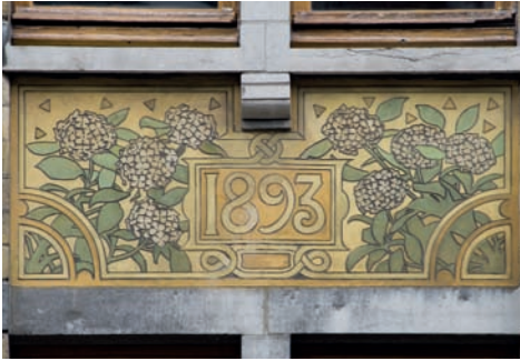
▲ Sgraffito, huis van architect Paul Hankar, Defacqzstraat 71, 1060 Sint-Gillis

De reactie op het academisme stuwde de Brusselse architecten aan het einde van de 19de eeuw in de richting van de art nouveau. Victor Horta, met zijn organische vormen, en Paul Hankar, die meer een voorkeur had voor het geometrische, riepen een architectuur in het leven die weldra internationaal vermaard zou zijn. Vanaf 1893 verschenen in ongeveer vijftien jaar tijd honderden art-nouveaugebouwen in de hoofdstad. Aanvankelijk werden ze gebouwd door de grote vernieuwers, later door hun leerlingen en nabootsers, die aan het begin van de 20ste eeuw ook geïnspireerd werden door de Wiener Secession en andere strekkingen in de Europese art nouveau.