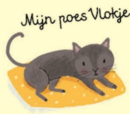
Mijn poes Vlokje