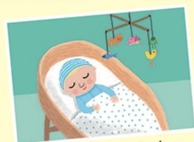
Onze nieuwe baby