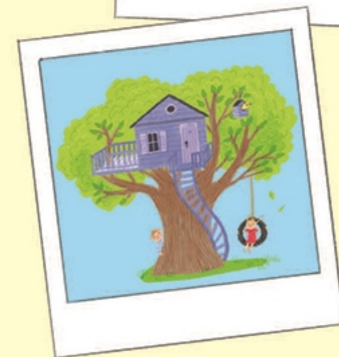
De boomhut van mijn neef