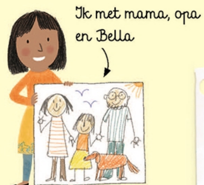
Ik met mama, opa en Bella