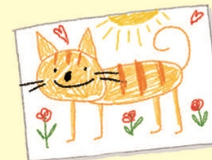
De kat van mijn tante