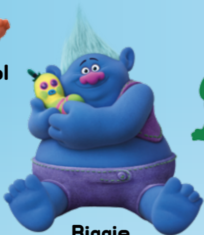
Biggie en Mr. Dinkles