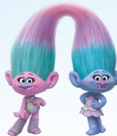
Satijn en Chanelle